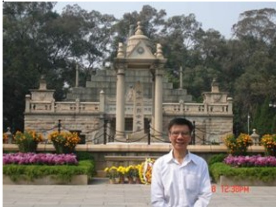
Phạm Hồng Thái