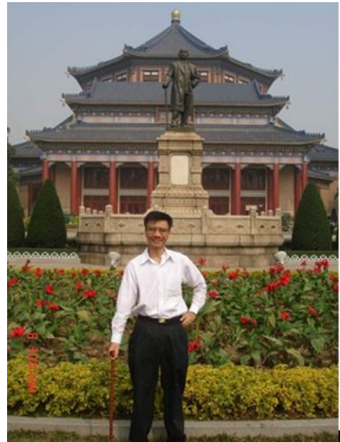
Bia Phạm Hồng Thái.