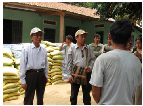
Cứu trợ vùng Dakglei