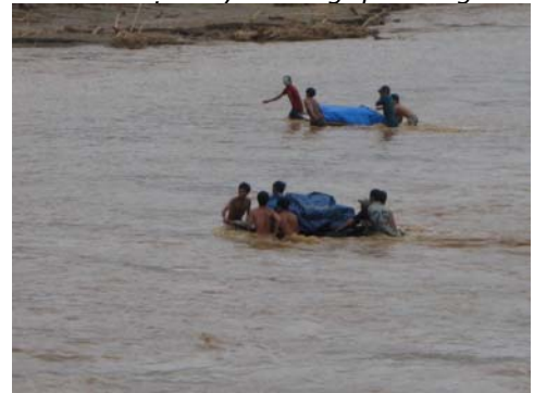
Cứu trợ bão lụt cho cô nhi Vinh Sơn 2